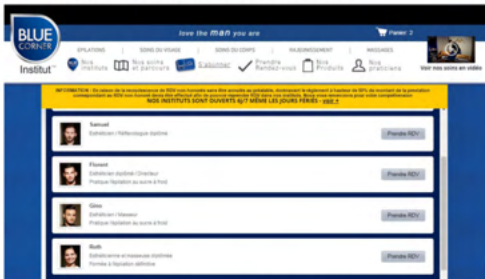
En fonction des compétences, le système lui propose une liste de praticiens