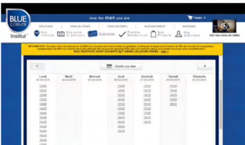
Le client choisit la date et l'heure de son RDV