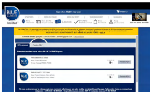
Le client choisit son institut

Un numéro unique pour la prise de RDV par téléphone. Vos appels manqués redirigés vers la centrale de prise de RDV parisienne. En cas de débordement, nous répondons à vos appels afin de ne rater aucune prise de rendez-vous. Nos hôtes(ses) d'accueil ont accès aux agendas de tous les instituts, sont formé(es) à la prise de rendez-vous et connaissent parfaitement les protocoles des soins BLUE CORNER afin de renseigner au mieux les potentiels clients.