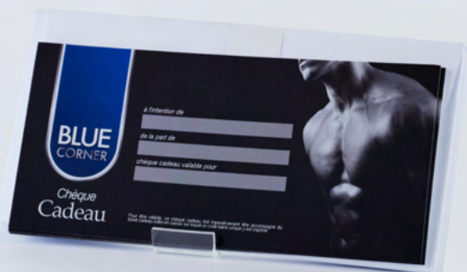
Planche PLV de comptoir A5