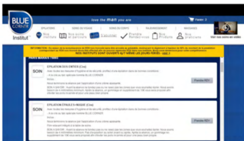
Puis la ou les prestations de son choix